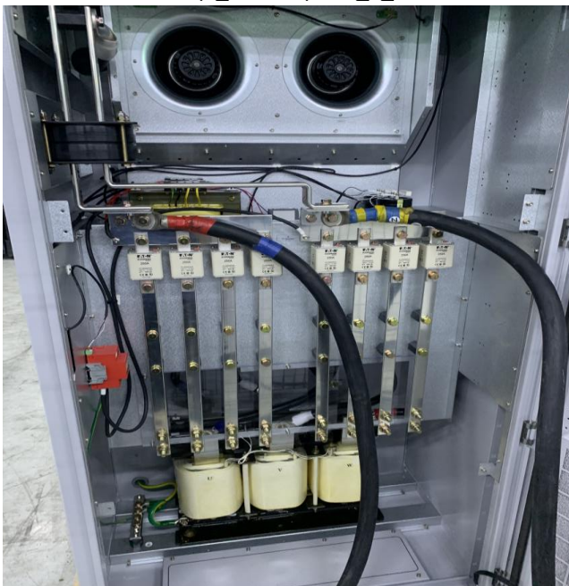
사진 1-3 시료 내 접속부