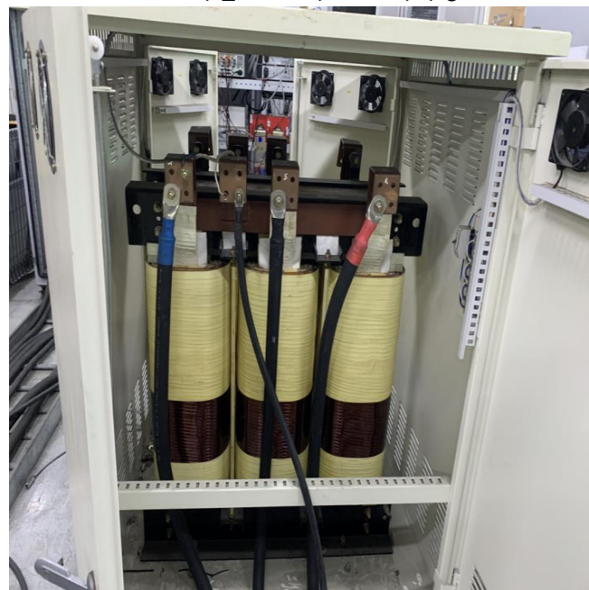
사진 1-4 변압기