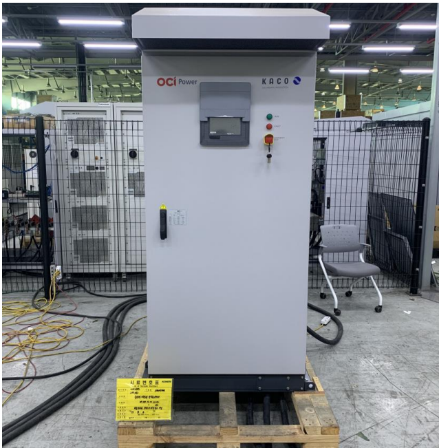
사진 1-1 시료 전면